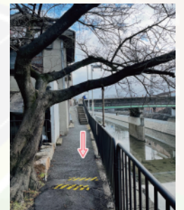
(京阪藤森駅疏水沿い)

京阪藤森駅近くの道。地域の皆さんに愛される桜の木、その根が道路を押し上げ、転倒の危険があるとの声が届きました。すぐに現地を確認し、関係機関と相談。どうすれば安全に、そして桜を大切に守れるかを検討。そこで、注意喚起の路面標示が施されました!これで、皆さんが安心して通れる道を守ることができました。