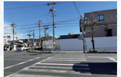
(竹田久保町交差点)

「音響信号の音が小さい」というお困りの声をいただきました。詳しく伺うために迎った先で分かったのは、視覚に障害のある方の切実なご要望でした。警察に要望を伝えると、迅速に調査を行い、音量を上げていただきました!真心で繋がったバトンが、課題解決への一歩を生みました。